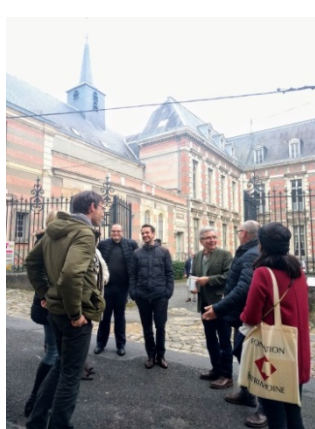
16/11/18 - Visite de la Fondation du Patrimoine pour effectuer un état des lieux des sites en péril dans le Sud de l'Aisne.

Ce site unique est en lice pour une opération d'envergure nationale, pilotée par l'animateur Stéphane BERN. Ce dernier s'appuie sur la Fondation du Patrimoine, association reconnue d'utilité publique, qui œuvre à la sauvegarde du patrimoine bâtis dans toutes les régions de France (notamment via le mécénat participatif). Chaque délégation régionale était chargée de présenter au siège une sélection de projets susceptibles d'être retenus par la mission BERN.