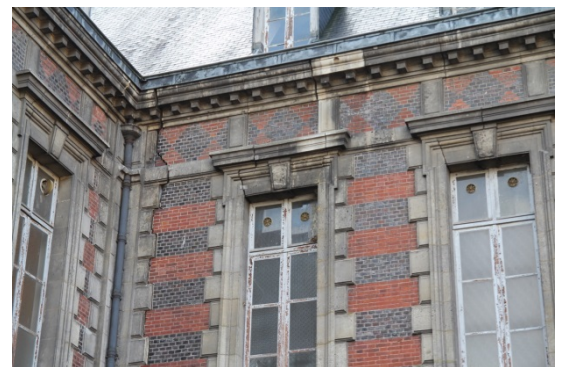
Fissures et dégradations multiples sont visibles sur toutes les façades du bâtiment.

L'Hôtel-Dieu a été bâti sur un terrain argileux dû au voisinage de la rivière Marne. Sa construction a nécessité l'implantation de pieux en bois de sept mètres plantés dans le sol. La nature de ses fondations, l'usure naturelle du temps et enfin l'histoire mouvementée de la ville de Château-Thierry (plusieurs fois bombardée) nous amènent à constater aujourd'hui d'importants désordres : de nombreuses fissures, dont certaines parcourent l'intégralité des murs du rez-de-chaussée jusqu'aux combles (sur 4 niveaux). L'Hôtel-Dieu n'a par ailleurs reçu aucun entretien préventif depuis plus de trente ans et ce jusqu'à son rachat par la collectivité en 2016. Le mauvais état de la toiture et notamment des chéneaux et descentes d'eau pluviales a entraîné un vieillissement accéléré des corniches, des maçonneries, provoquant d'importantes dégradations visibles sur la totalité des façades : linteaux de fenêtres affaissés, descellement de pierres, fragilisations des allèges et appuis de fenêtres ainsi que des remblais de fondations qui rendent « urgentes » les interventions à apporter au bâtiment, selon les termes d'une étude réalisée en 2012 par Edouard de Bergevin, architecte du patrimoine.