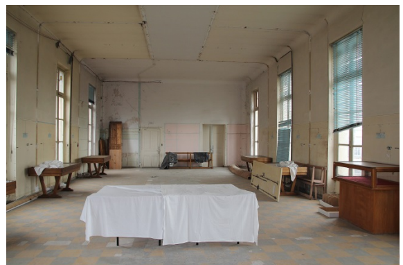
La rénovation des salles réservées aux malades permettrait l'extension du musée actuel avec le prêt de collections d'autres musées hospitaliers de France.

Les salles de malades du XIXe siècle ont encore conservé leurs volumes malgré d'importantes dégradations. La rénovation complète des lieux permettra l'extension du musée actuel, qui pourra accueillir les dépôts d'autres musées hospitaliers actuellement fermés et ainsi acquérir une importance nationale sur le sujet. Le musée abrite d'ores et déjà des collections de grande qualité (orfèvrerie d'Ancien Régime, peintures signées Largillierre et Louis de