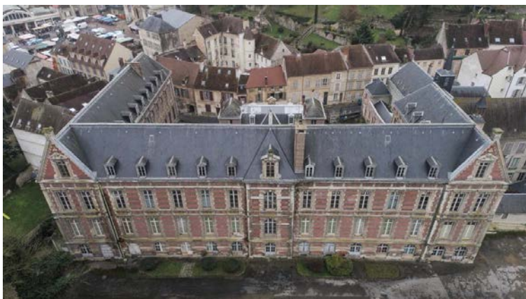
L'Hôtel-Dieu situé au cœur du centre-ville de Château-Thierry recouvre des volumes et des surfaces importantes à restaurer (vue aérienne de la partie XIXe siècle).